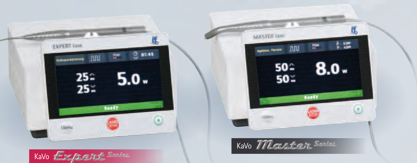
KaVo Expert Series