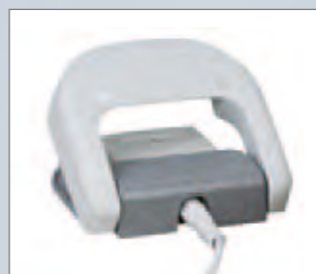
KaVo EXPERT lase Fussanlasser

Neben einer der komfortabelsten und modernsten Methode für minimalinvasive Eingriffe überzeugen KaVo MASTER lase und KaVo EXPERT lase durch ein hervorragendes Preis-Leistungsverhältnis und den sicheren KaVo Service. Damit wird der KaVo Diodenlaser für Sie und Ihre Patienten zur äußerst interessanten Ergänzung Ihres Praxisangebotes.